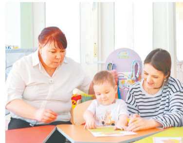
В группе мам помогает воспитатель

кам и средам дети занимаются музыкой, а по четвергам проходят спортивные активности.