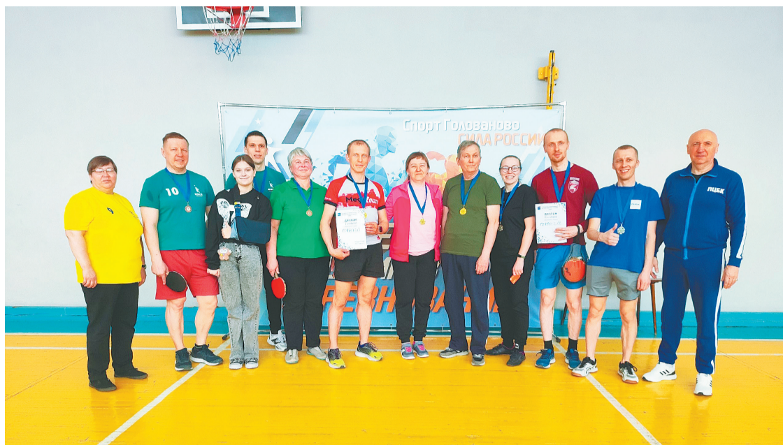
Организаторы Спартакиады – ПЦБК и Союз активной молодежи предприятия при участии ДК «Бумажник».

Поздравляем победителей, призёров и участников турнира, а болельщиков благодарим за поддержку. Следующим этапом соревнований станет первенство по волейболу.