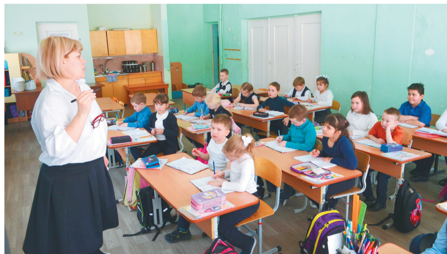
Уроки у 1-х и 2-х классов проходят в детском саду

Стоит отметить, что наши кадеты участвуют во Всероссийской спартакиаде и занимают призовые места уже второй год подряд. Помощь в организации поездок оказывает Пермская целлюлозно-бумажная компания.