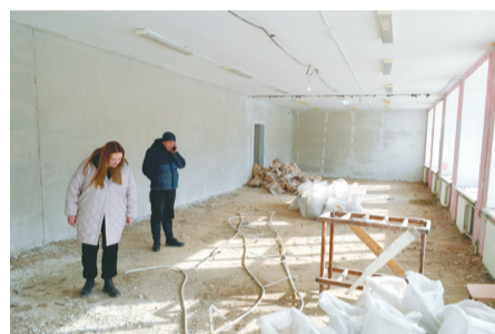
Будущий актовый зал на 120 мест