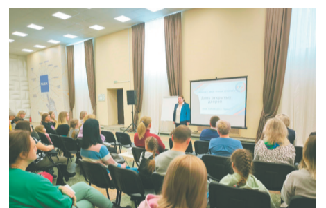
День открытых дверей школы № 123 прошёл в ДК «Бумажник»

Например, в марте кадеты 5 класса вновь стали финалистами Всероссийской спартакиады по военно-спортивному многоборью «Призывники: службу России – 2024». На соревнованиях в Москве ребята из Голованово заняли призовые места, боролись за победу с лучшими командами со всей стра-