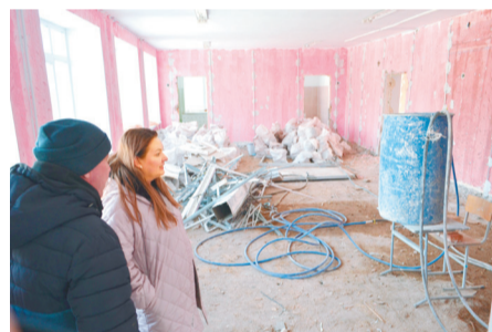
Школьный коридор на третьем этаже

Кроме того, строители приступили к ремонту мягкой кровли корпуса, где располагается школьная столовая. Здесь также идёт демонтаж старого покрытия. Ремонт освещается в местном сообществе «PRO Голованово» социальной сети «ВКонтакте». Жители микрорайона следят за процессом вместе с учениками, родителями и работниками школы.