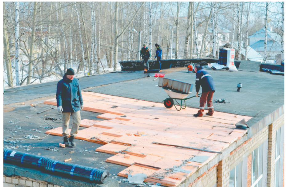
Ремонт кровли школьной столовой

На данном этапе строители избавляются от всего старого: убирают напольные покрытия и отделку стен, демонтируют сантехнику и кирпичную кладку, проводку и другие коммуникации. Постепенно идёт предчистовая отделка – выравнивание и штукатурка стен. Все работы ведут с третьего этажа, спускаясь вниз.